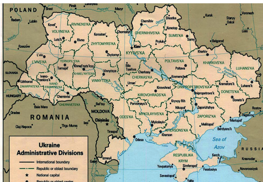
Rys. 2. Podział administracyjny Ukrainy