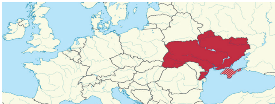
Rys. 1. Położenie Ukrainy na mapie Europy

jednoizbowy parlament – Najwyższa Rada Ukrainy (Верховна Рада України) – wybierany na pięcioletnią kadencję. Stolicą państwa i siedzibą władz najwyższych jest Kijów. Ukraina to członek wielu organizacji międzynarodowych, m.in. Organizacji Narodów Zjednoczonych, Wspólnoty Niepodległych Państw, Międzynarodowego Funduszu Walutowego, Organizacji Bezpieczeństwa i Współpracy w Europie, Rady Europy i Światowej Organizacji Handlu.