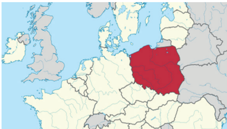
Rys. 4. Położenie Polski na mapie Europy