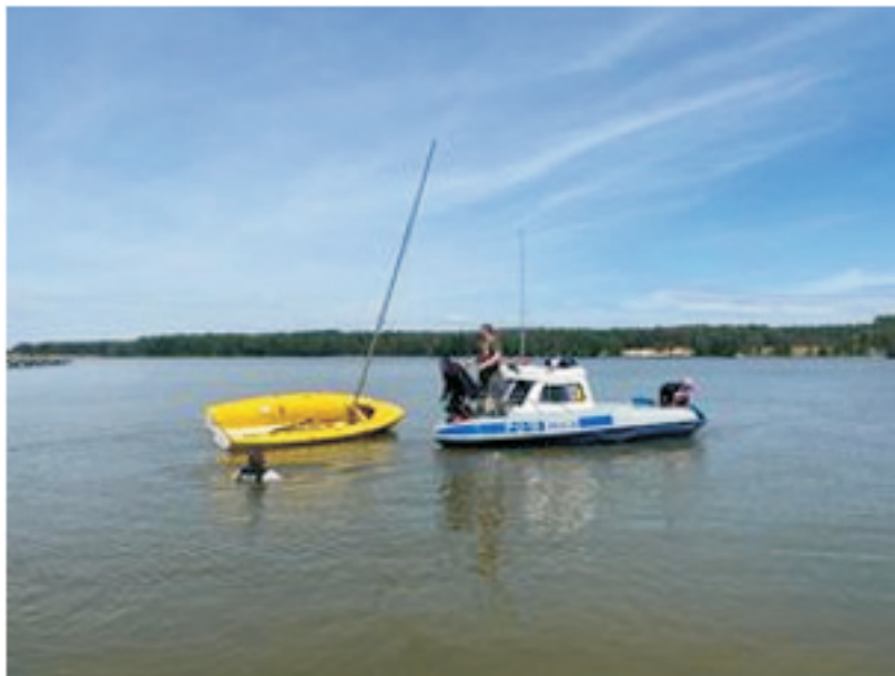
Rys. 1. Pomoc poszkodowanym