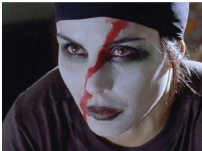
Fot. 1. Lisbeth Salander (Noomi Rapace) w filmie pt. Dziewczyna, która igrała z ogniem , 2009

Na użytek analizy zawartej w artykule stawiam następującą tezę: Lisbeth Salander swoją popularność i miano ikony popkultury zawdzięcza temu, że jest „uczłowieczoną” superbohaterką walczącą o własne bezpieczeństwo, w kontekście realnych zagrożeń współczesnego społeczeństwa: przemocy instytucjonalnej, przemocy wobec kobiet, patologii systemu politycznego.