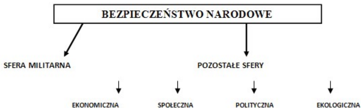
Rys. 1. Sfery bezpieczeństwa narodowego

wewnętrzne (tj. terroryzm, tendencje nacjonalistyczne i podziały ideologiczne) 1 . Zmiany zachodzące w obszarze współczesnych zagrożeń bezpieczeństwa państwa sprawiają, że tradycyjnie pojmowane bezpieczeństwo narodowe – militarne przechodzi na drugi plan, bowiem militarne zagrożenia zewnętrzne są ograniczone, podczas gry wzrasta ranga zagrożeń wewnętrznych, zwłaszcza asymetrycznych 2 . Rośnie zatem znaczenie pozostałych sfer bezpieczeństwa, tj. ekonomicznej, społecznej, politycznej i ekologicznej.