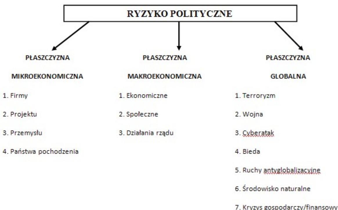
Rys. 2. Ryzyko polityczne – płaszczyzny i ich składowe

Ryzyko polityczne w ujęciu mikroekonomicznym (mikro) odnosi się do działalności przedsiębiorstw w danej branży na rynkach zagranicznych. Ch. Hill definiuje ryzyko polityczne jako prawdopodobieństwo, że działania polityczne spowodują drastyczne zmiany w otoczeniu gospodarczym, które niekorzystnie wpłyną na zyski lub inne cele aktywności gospodarczej przedsiębiorstwa 14 .