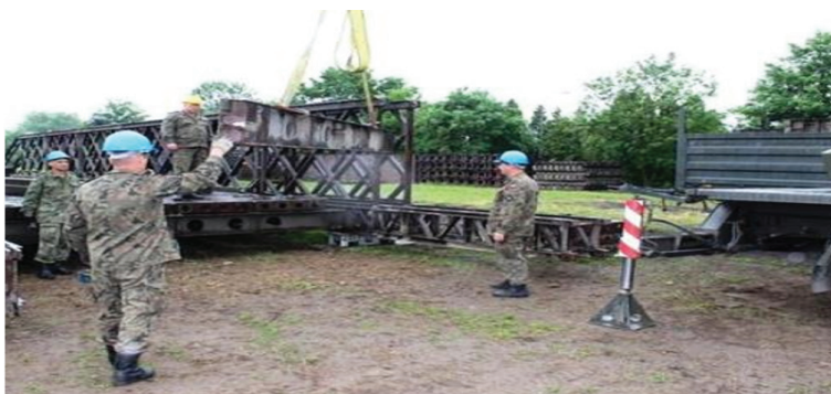
Rys. 2. Składanie mostu DMS-65 przez żołnierzy WJO

Przykładem wykorzystania WJO do likwidacji skutków klęsk żywiołowych jest sytuacja w gminie Mszana Dolna. Gmina Mszana Dolna nie była w stanie przywrócić dojazdu dla mieszkańców, dlatego zwrócono się do Wojewody Małopolskiego o pomoc w realizacji tego zadania. Z kolei Wojewoda Małopolski wystąpił do Ministra Obrony Narodowej o skierowanie do Gminy Mszana Dolna Jednostek Inżynieryjnych Wojska Polskiego w celu wybudowania mostów tymczasowych typu DMS. Umowa cywilnoprawna została podpisana pomiędzy przedstawicielami gminy Mszana Dolna a dowódcą 3 Batalionu Inżynieryjnego w Nisku. Wojskowi zerwali stary most żelbetowy przez katastrofalne wezbranie potoku podczas intensywnych opadów atmosferycznych, które wystąpiły w dniach 6-7 sierpnia 2014 r. W okresie ok. dwóch tygodni żołnierze z wykorzystaniem ciężkiego sprzętu specjalistycznego (m.in. UMI – uniwersalna maszyna inżynieryjna, kafar KP-2S, elektrownie siłowe, dźwigi) postawili tymczasowy most typu DMS-65 o długości około 35 m.