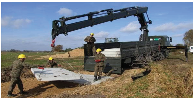
Rys. 4. Remont dróg w gminie Hanna