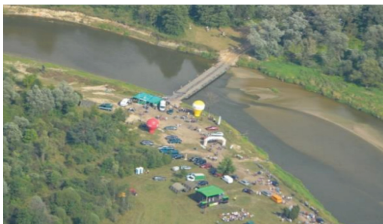
Rys. 6. Most pontonowy na rzece Bug