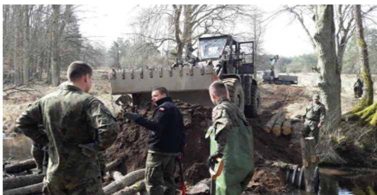
Rys. 5. Naprawa drogi pożarowej w CSWL