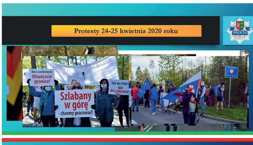
Zdjęcie 3. Protesty społeczne na granicy zachodniej Rzeczypospolitej Polskiej