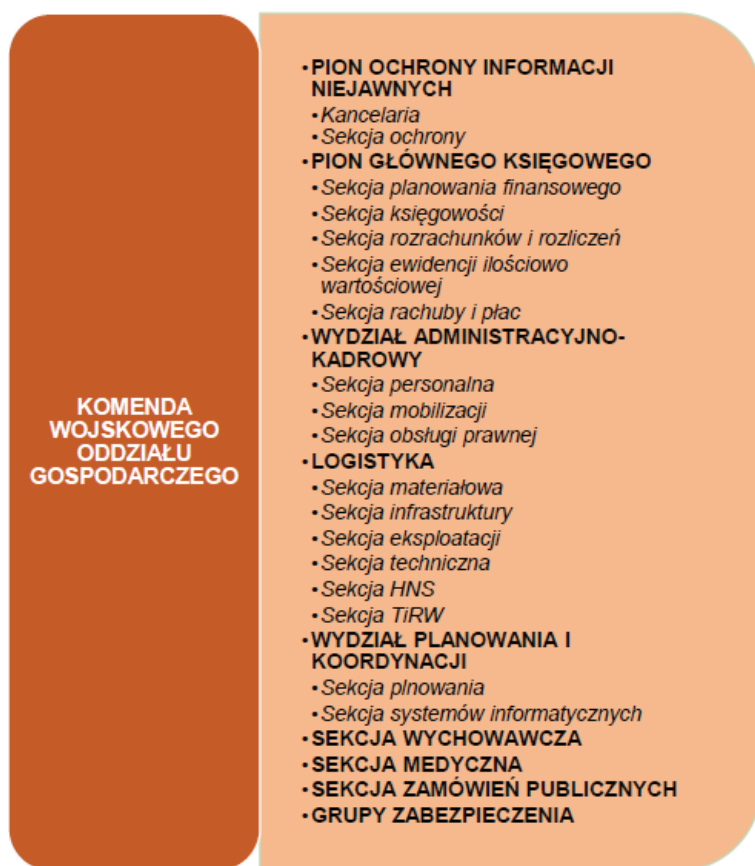
Rys. 1. Przykładowa struktura Wojskowej Jednostki Organizacyjnej