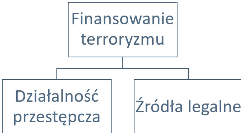
Rys. 3. Źródła finansowania terroryzmu