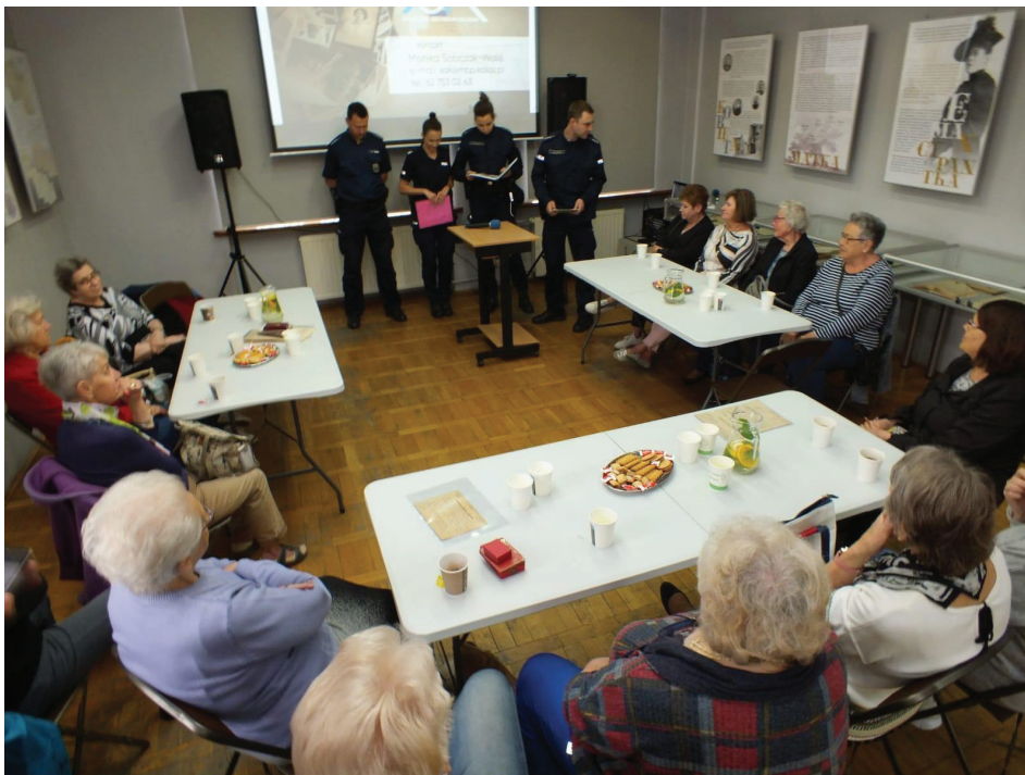
Rys. 3. Dzielnicowi podczas spotkania ze społecznością lokalną na temat oszustw