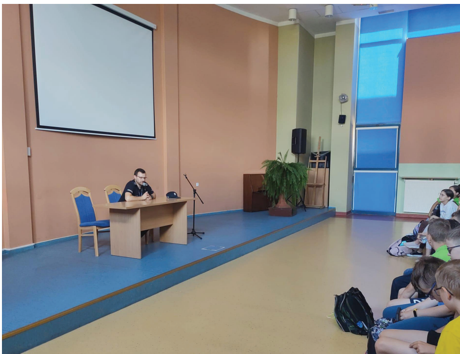
Rys. 2. Dzielnicowy w trakcie przeprowadzania zajęć w szkole

Z powyższej analizy wynika, że w większości dostępnych źródeł rola dzielnicowego w czynnościach związanych w przeciwdziałaniu atakom terrorystycznym jest pomijana. W głównej mierze uwaga kierowana jest na edukację, którą prowadzi szeroko pojęta instytucja Policji jako całość. Funkcja dzielnicowego nie jest wyróżniana pomimo, iż to dzielnicowi Policji są funkcjonariuszami najbliższymi lokalnej społeczności. To oni posiadają wiedzę w jaki sposób przekazywać trudne informacje tak by nie wzbudzać lęku i paniki.