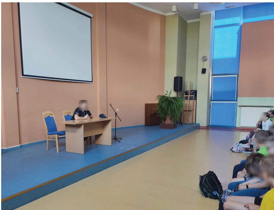
Rys. 2. Dzielnicowy w trakcie przeprowadzania zajęć w szkole

Z powyższej analizy wynika, że w większości dostępnych źródeł rola dzielnicowego w czynnościach związanych w przeciwdziałaniu atakom terrorystycznym jest pomijana. W głównej mierze uwaga kierowana jest na edukację, którą prowadzi szeroko pojęta instytucja Policji jako całość. Funkcja dzielnicowego nie jest wyróżniana pomimo, iż to dzielnicowi Policji są funkcjonariuszami najbliższymi lokalnej społeczności. To oni posiadają wiedzę w jaki sposób przekazywać trudne informacje tak by nie wzbudzać lęku i paniki.