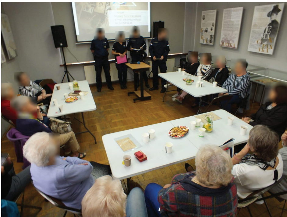
Rys. 3. Dzielnicowi podczas spotkania ze społecznością lokalną na temat oszustw

Pomimo pełnienia przez dzielnicowych Policji tak istotnej roli w całym systemie kształcenia jest ona bagatelizowana. Funkcjonariusze muszą samodzielnie mierzyć się z ograniczeniami jakie napotykają w trakcie pełnienia służby. Przede wszystkim istnieje możliwość nieposiadania przez dzielnicowych specjalistycznej wiedzy z uwagi na fakt, że nie są wysyłani na szkolenia. Jest to spowodowane dużą ilością wakatów w Policji i sporym zapotrzebowaniem osób mogących pełnić służbę. W wielu miastach na terenie Polski dzielnicowi nie tylko pełnią służbę dochodową ale również patrolową. Skutkuje to pochłanianiem czasu pracy dzielnicowych w trakcie którego byłoby możliwe zorganizowanie i przeprowadzenie spotkania ze społeczeństwem. Wynika to również z tego, iż rejony wyznaczone dzielnicowym są zawsze obsadzone przez funkcjonariuszy, mimo braków kadrowych w ogniach patrolowo-interwencyjnych. Powoduje to nadmierne obciążenie dzielnicowych co w przyszłości może doprowadzić do wypalenia zawodowego. Przemęczenie może prowadzić do popełniania błędów i zaniedbań, co może mieć poważne konsekwencje, zwłaszcza w kontekście pracy dzielnicowych. Ze względu na zbyt duże obciążenie nadprogramowymi obowiązkami funkcjonariusze szybko mogą stracić motywację do dalszej pracy. Ponadto mieszkańcy mogą utracić zaufanie do dzielnicowych,